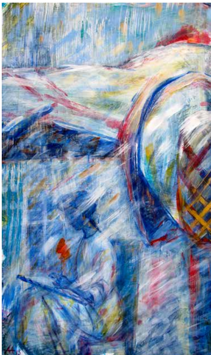
Асеева Елена. "Снег". Дерево, акрил, 60X100 см., 2015 г.