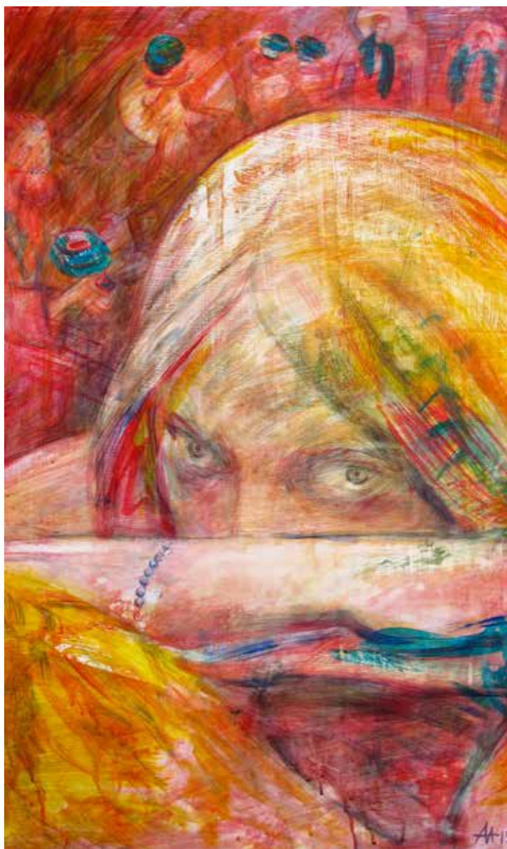
Асеева Елена. "Кровь". Дерево, акрил, 60X100 см., 2015 г.