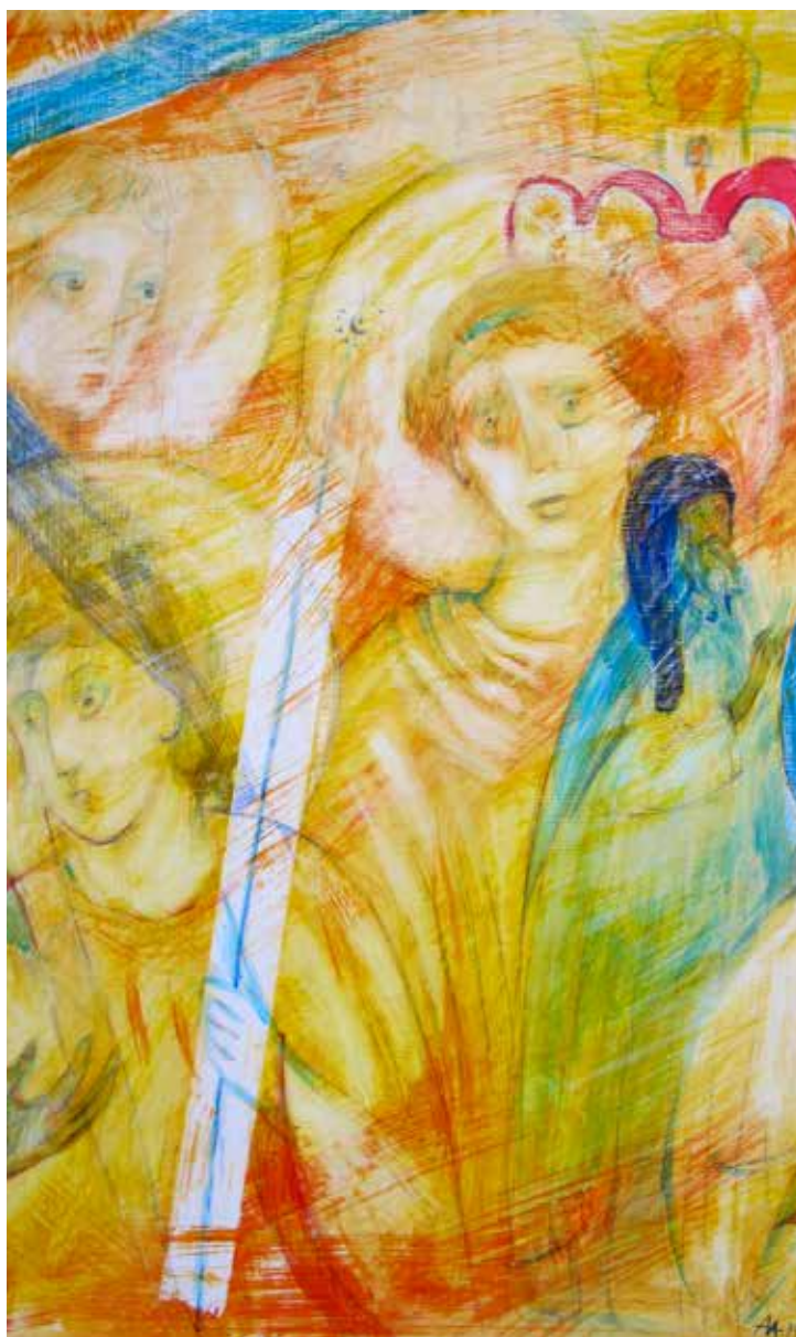
Асеева Елена. "Мастер". Дерево, акрил, 60X100 см., 2015 г.