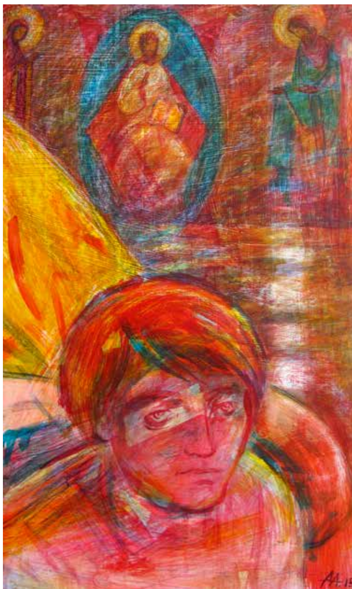
Асеева Елена. "Огонь". Дерево, акрил, 60X100 см., 2015 г.