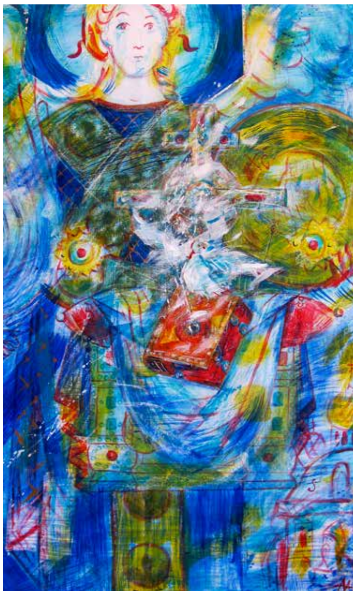
Асеева Елена. "Престол". Дерево, акрил, 60X100 см., 2015 г.