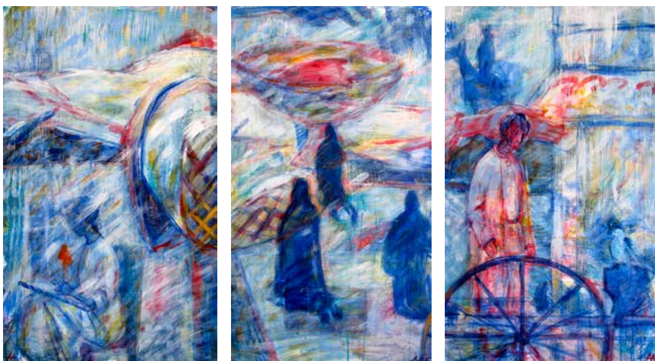
Асеева Елена. Триптих "Снег". Дерево, акрил, 180 X100 см., 2015 г.