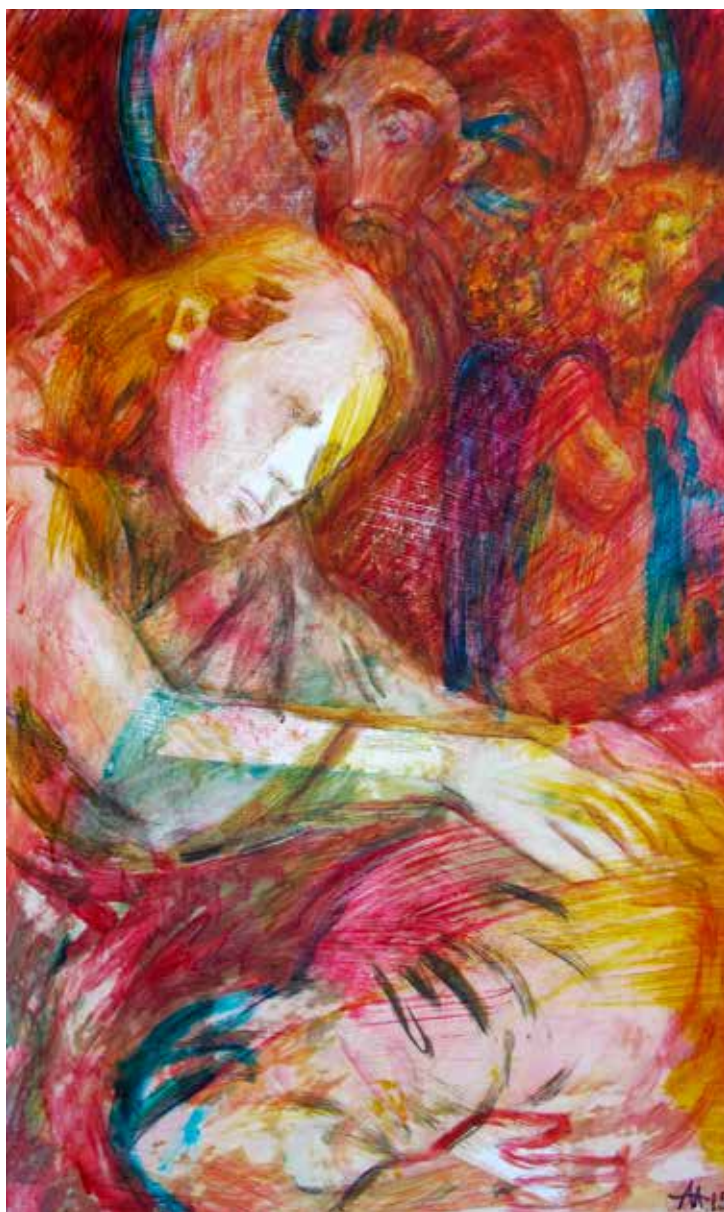
Асеева Елена. "Река". Дерево, акрил, 60X100 см., 2015