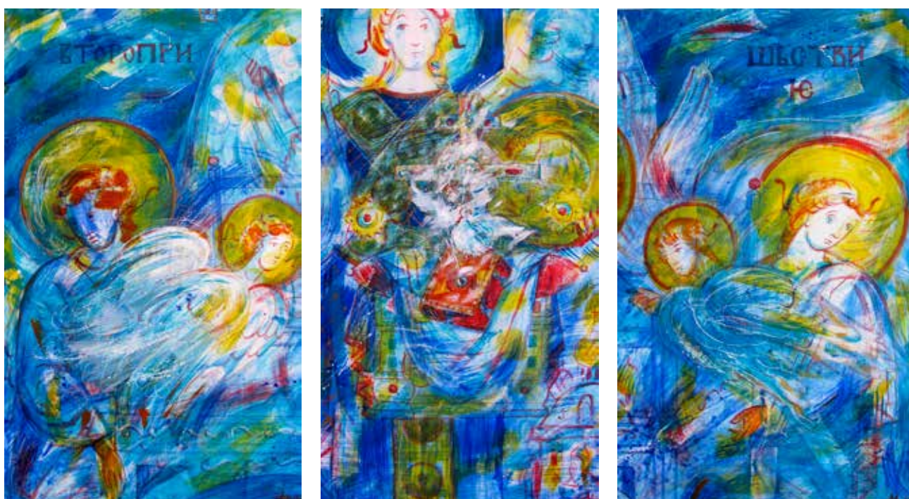
Асеева Елена. Триптих "Врата". Дерево, акрил, 180 X100 см., 2015 г.