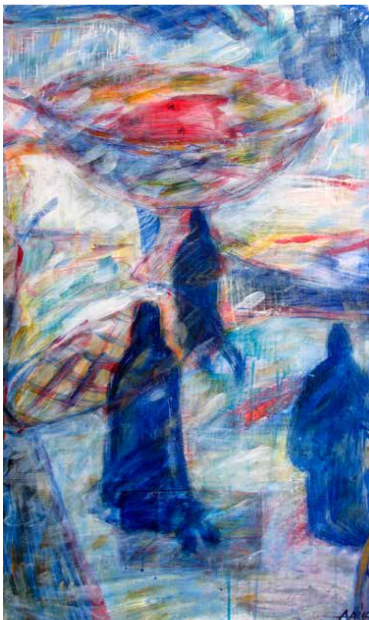
Асеева Елена. "Дорога". Дерево, акрил, 60X100 см., 2015 г.